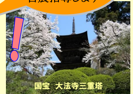
国宝 大法寺三重塔