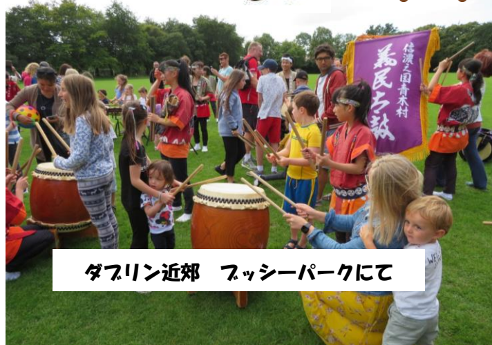
ダブリン近郊 フッシーパークにて

お子さん連れのご家族に和太鼓を体験してもらいました。日本人で現地に在住されている方、ピクニックを楽しんでいる方、前日の評判を聞き駆けつけた方も多く、自然と笑顔あふれる交流が図れました。