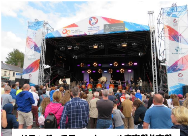
ドロヘダ フラワー・キョール音楽祭前夜祭

こまゆみ会のメンバーとアイルランド文化交流事業をご支援いただいた多くの皆様に感謝しています。