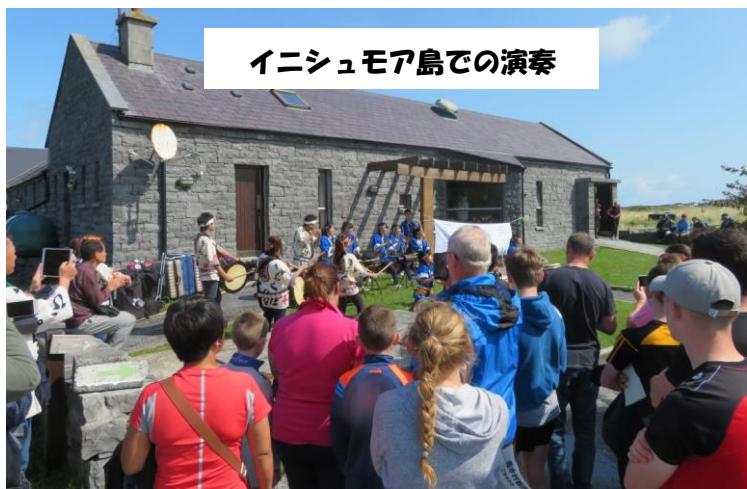
イニシュモア島での演奏

この地での路上ライブにも、 人々や観光客も立止まり、いつ の間にか大観衆となりました。 ここでのお昼は和食のお弁当で ちょっとした遠足気分でした。