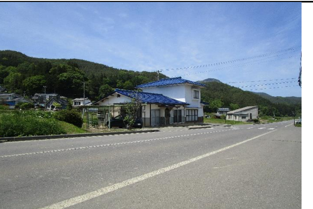
前面道路から撮影