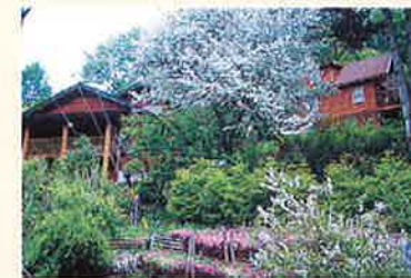
花の手入れが行き届いた別荘