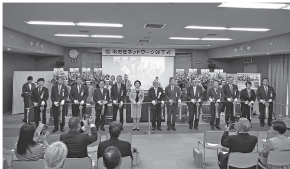
竣工を記念してのテープカット

令和6年7月より事業を進めてきましたあおきネットワーク(青木村情報通信ネットワーク等高機能化促進事業)が完成し、3月25日に竣工式が行われました。村内外のご来賓をはじめ、事業にご協力いただいた事業者、各地区の協力委員、応援委員のみなさまなど、約130名の出席のもと、事業の完成を祝いました。式では、村長の式辞をはじめ、ご来賓のご祝辞、施工いただいた事業者のみなさまへの村からの感謝状授与などを行いました。今後は、安心して快適な情報環境の中、村民のみなさまの豊かな暮らしを支える、頼れてやさしいネットワークとして運営をしてまいります。