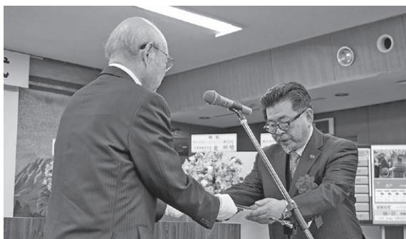
UCV母袋社長への感謝状授与