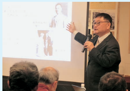
慶太と故郷信州との関係や、長野県各地で行なわれた慶太の仕事について語っていただきました。