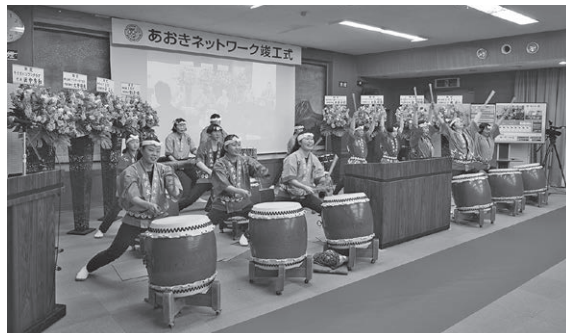
義民太鼓保存会のみなさまによる祝太鼓