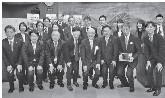
整備にご協力いただいた事業者のみなさま