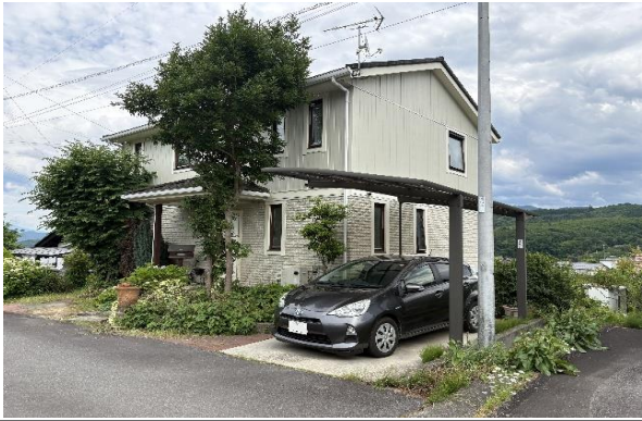
前面道路から撮影