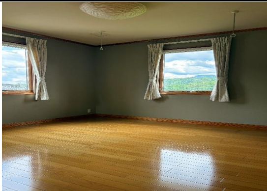
洋室からは夫神岳、上田市街が望める