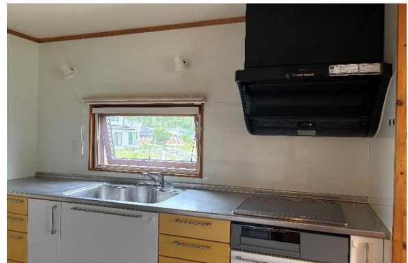
キッチンの大きな窓からは光が差し込む