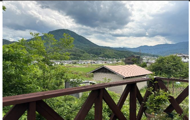
ウッドデッキからの眺め